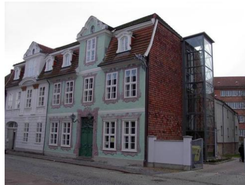
Ansicht des Hauses der Kirche in Güstrow

Parkplätze befinden sich südlich des Schlosses und östlich des Schlossgartens, ebenfalls etwa 10 min zu Fuß vom Ort der Veranstaltung entfernt.