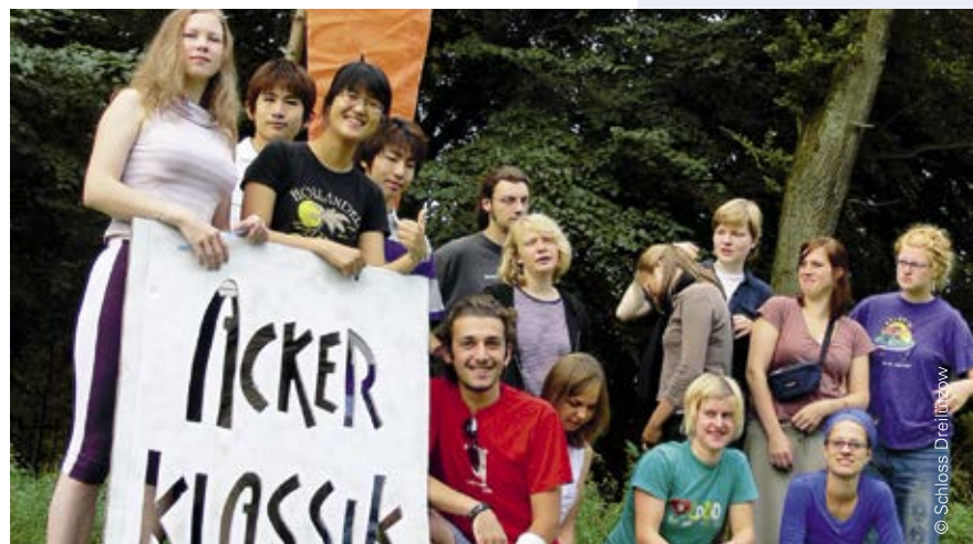
„Alles klar?“ – Gute interne Kommunikation in der Begegnungsstätte Schloss Dreilützow ist für das Projekt „AckerKlassik“ unerlässlich.