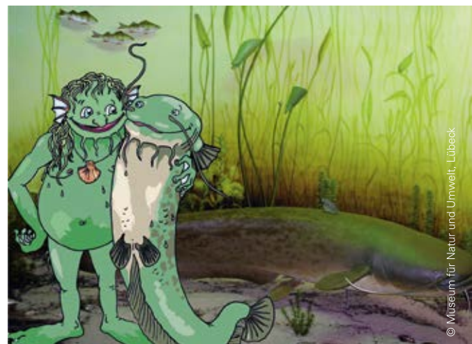
Medienvielfalt: Mit Postkarten wirbt das Museum für Natur und Umwelt in Lübeck für seine Erlebnisausstellung