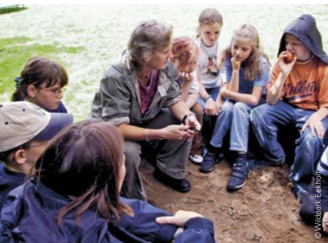
Die Mitarbeiterinnen und Mitarbeiter im Wildpark Eekholt sind für die Methode „Philosophieren mit Kindern“ speziell ausgebildet

Die Vergütung der pädagogisch verantwortlichen Personen sollte „angemessen“ sein (d. h. den Mindestlohnanforderungen genügen oder in der Höhe vergleichbar mit anderen pädagogischen Beschäftigungsverhältnissen sein). Dies dient dazu, die Qualität zu sichern und weiterzuentwickeln. Bewertet wird dies jedoch nicht, um die Arbeit überwiegend ehrenamtlich tätiger Einrichtungen zu unterstützen.