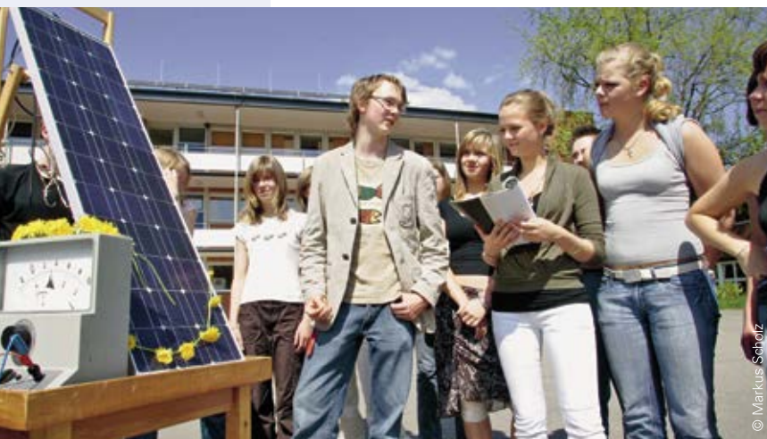
Um Energie begreifbar zu machen, werden Methoden eigens für Schulklassen ausgewählt

Das pädagogische Konzept muss aufzeigen, wodurch sich das Bildungsangebot von fachspezifischen Veranstaltungen abhebt, beispielsweise im Bereich Umweltbildung, entwicklungspolitischer Bildung oder Naturerleben. Die BNE-gerechte Umsetzung ist beispielhaft an mindestens einem Angebot aufzuzeigen.