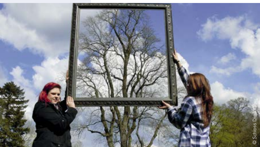
Die Zertifizierung bietet einen „Rahmen“ für unterschiedliche Akteure...

Das NUN-Zertifikat gilt für fünf Jahre. Für eine Re-Zertifizierung müssen Fortschritte nachgewiesen werden – dies gilt vor allem hinsichtlich der Empfehlungen der Zertifizierungskommission.