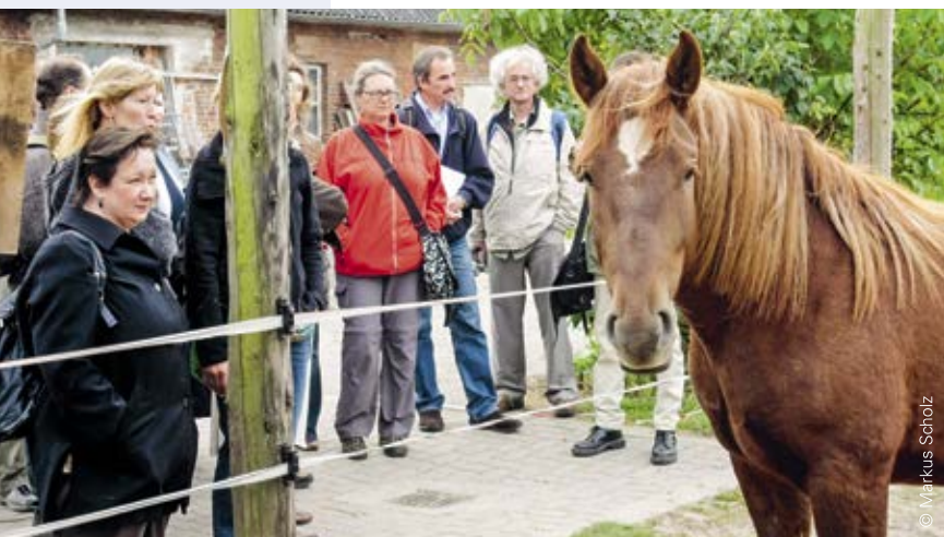
Durch Qualitätsentwicklung ein „Alleinstellungsmerkmal“ finden, z. B. Bildungsurlaube zum Thema Landwirtschaft

„Wir werben mit dem Zertifikatslogo auf unseren Broschüren und werden auch darauf angesprochen.“