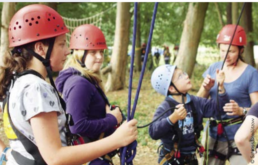
Qualität und Sicherheit für Kundinnen und Kunden durch das NUN-Zertifikat - hier der Hochseilgarten von Schloss Dreilützow