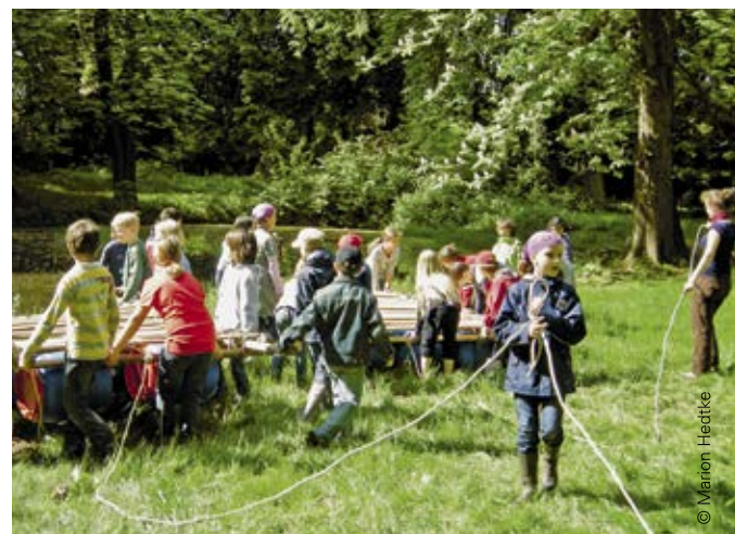
Das NUN-Zertifikat steht für moderne Pädagogik – Naturerleben, Wissens- und Kompetenzerwerb zugleich