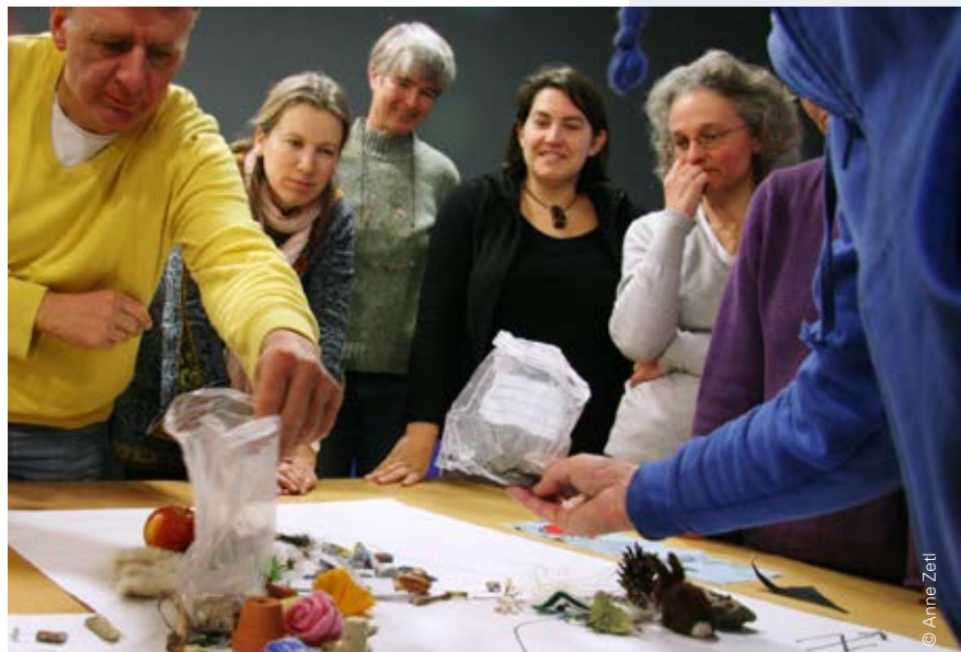
Ein Koffer voller Handwerkszeug: Methoden und Arbeitsweisen zur Gestaltung von BNE