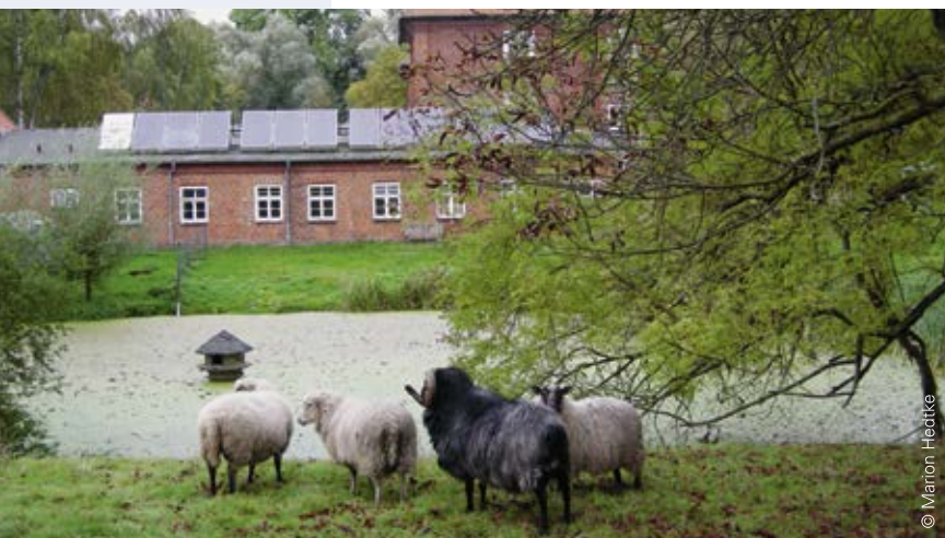
Das Schullandheim Schloss Dreilützow nutzt die Kraft der Sonne