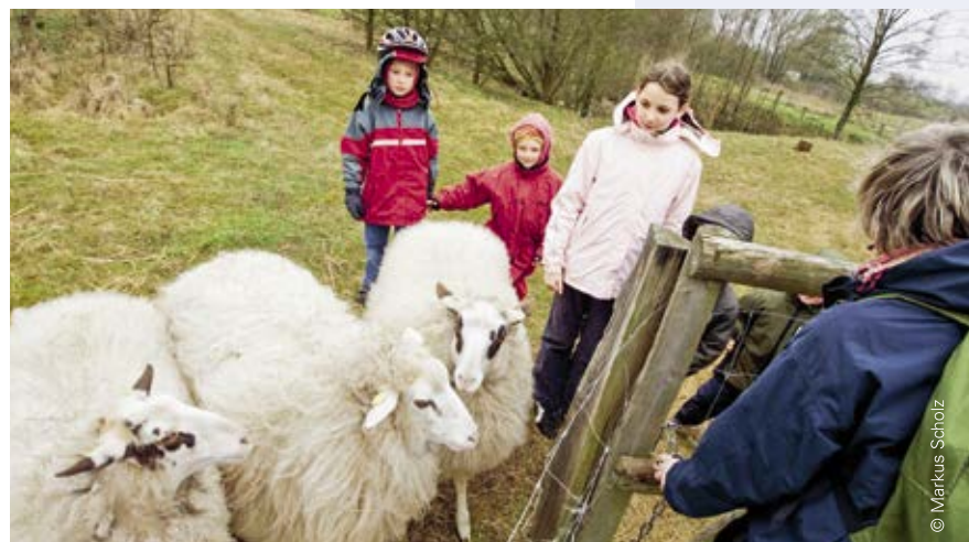
Ein Schulbauernhof mit Schafhaltung muss besondere Sorgfalt auf gute Infrastruktur legen