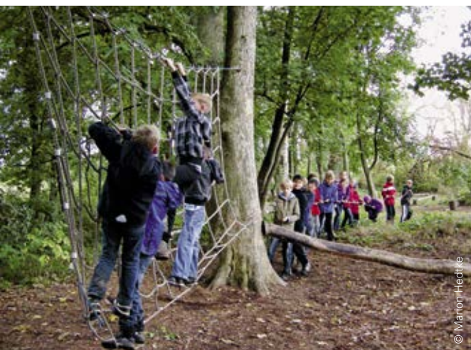
Beim Besuch der Prüfgruppe stehen Besonderheiten wie die erlebnispädagogische Ausrichtung im Schulandheim Dreilützow im Fokus

Weitere Schritte: FORTBILDUNGEN, SELBSTEVALUATION, RE-ZERTIFIZIERUNG