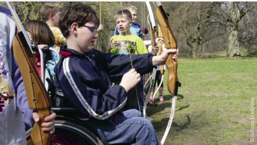
Menschen mit Behinderungen gehören für die Begegnungsstätte Schloss Dreilützow zum Konzept

In Bildungseinrichtungen und -zentren (Stufe II und III) werden darüber hinaus auch Aspekte der internen Zusammenarbeit und Kommunikation skizziert. Die Führungskräfte sind verantwortlich für die Umsetzung des Leitbildes. Gerade für die Akzeptanz und dafür, das Leitbild auch zu „leben“ ist eine gemeinsame Erarbeitung mit allen Mitarbeitenden jedoch entscheidend.