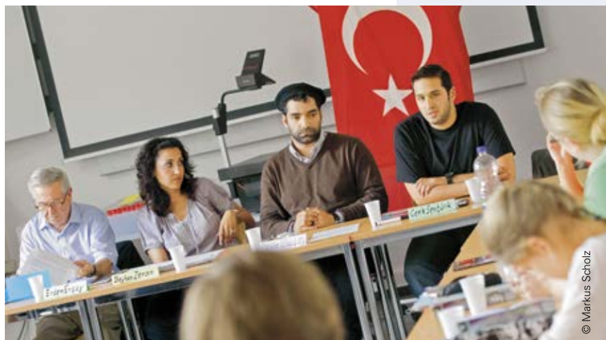
Ganz unterschiedliche Bildungsanbieter können zertifiziert werden – auch Einrichtungen mit politischem oder sozialem Schwerpunkt