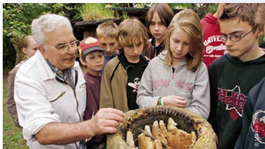
Die Hamburger Klimaschutzstiftung in Gut Karlshöhe arbeitet mit Fachleuten vom Imkerverein Bramfeld zusammen