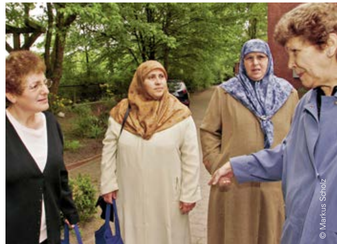
Menschen mit Migrationshintergrund werden als Zielgruppe im Leitbild berücksichtigt