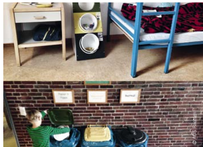
Das Schullandheim ADS Rantum integriert die Mülltrennung auf den Zimmern in seine Bildungsarbeit