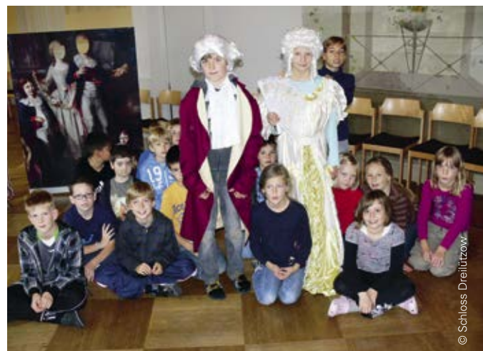
Beratung und Reflexion sind gute Voraussetzungen für Erfolg in der Zukunft – daher ist eine jährliche Selbstevaluation wichtig