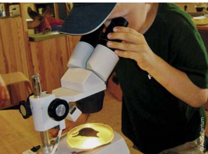
Das zertifizierte „Wattlabor“ des Schullandheims ADS in Rantum vermittelt Bildung mit Qualitätssiegel

Die Qualitätsbereiche werden durch unterschiedliche Qualitätskriterien konkretisiert. Im Zertifizierungs-Leitfaden werden die entsprechenden Nachweise aufgeführt. Vielleicht können nicht alle Kriterien gleich zu Beginn erfüllt werden. Die Zertifizierungskommission unterstützt Sie gerne schon vor Abgabe des Antrags auf Zertifizierung. Sie spricht im weiteren Verlauf Empfehlungen aus und weist auf Entwicklungspotenziale hin.