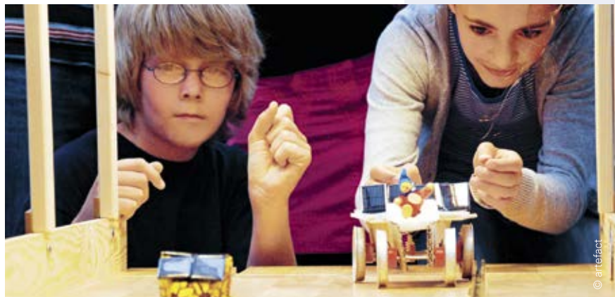
NUN-zertifiziert: Die Bildungseinrichtung artefact in Glücksburg organisiert den Schleswig-Holstein-Solar-Cup