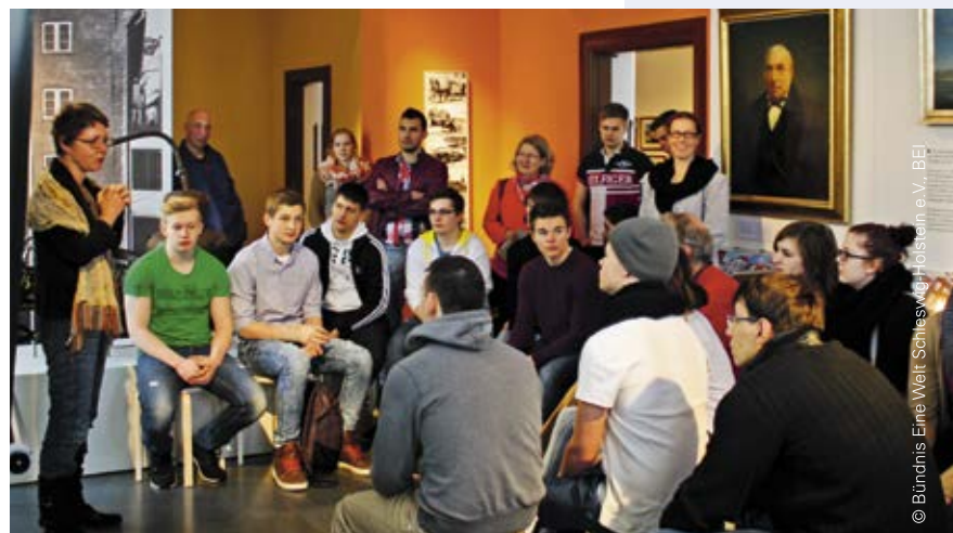
Interdisziplinäre Zusammenarbeit beim Projekt „Eine Welt im Museum“ zwischen Weltläden, Schifffahrtsmuseum und der Fachoberschule in Flensburg