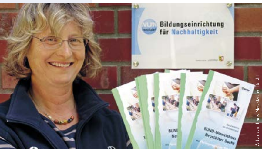
Das NUN-Zertifikat hängt als Schild an prominenter Stelle im Eingangsbereich des Umwelthauses Neustädter Bucht

Bildungszentren (Stufe III) sollen darüber hinaus Bildungsangebote für die Zielgruppe der Multiplikatorinnen und Multiplikatoren vorhalten und sich an überregionalen Kampagnen mit BNE-Bezug wie beispielsweise Aktionstagen zur Nachhaltigkeit beteiligen.