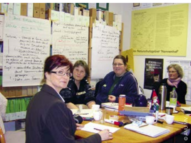
Die ANU Mecklenburg-Vorpommern bietet Fortbildungen für Multiplikatorinnen und Multiplikatoren an

Von Bildungszentren (Stufe III) wird gefordert, dass sie darüber hinaus auch in bestimmten Themenbereichen vernetzend arbeiten und hier z. B. Fortbildungen zu BNE-relevanten Themen für Multiplikatorinnen und Multiplikatoren anbieten.