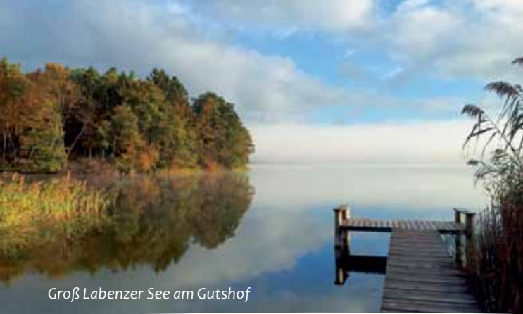
Groß Labenzer See am Gutshof